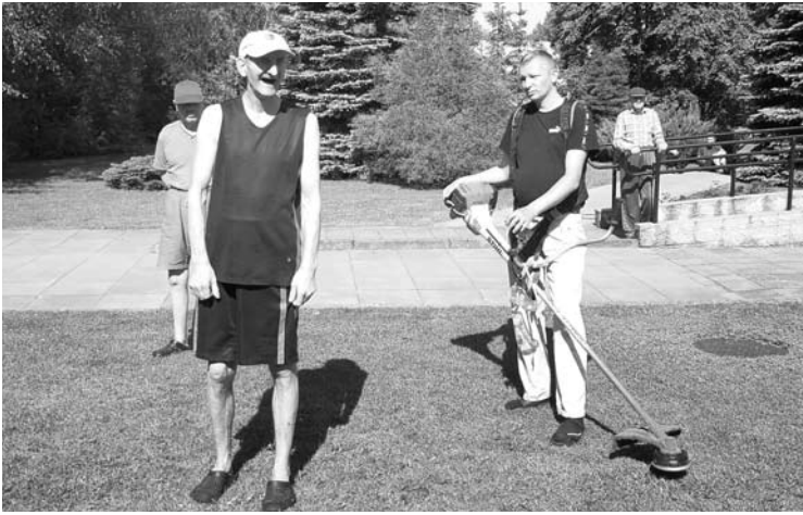
Leliūnų filialo gyventojai vis entuziastingiau dalyvauja aplinkos tvarkymo talkose.

Gegužės 24 dieną, penktadienį, Aknystos socialinės globos namų Leliūnų filialo gyventojai tvarkė Leliūnų kaimo viešąsias erdves.