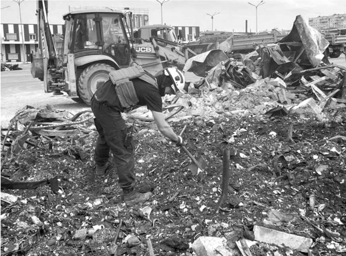
Policininkai pelenuose ieško žmogaus kūno dalelių.